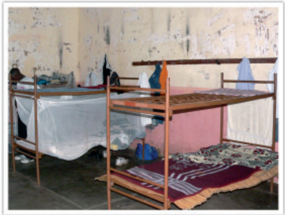
Die Unterkunft der Theologiestudenten

Die Wasserversorgung des Ortes funktioniert inzwischen reibungslos. Seit Monaten haben die Häu-