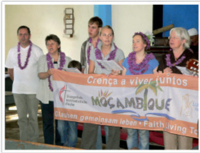
Besuch aus Lage

eine Gruppe von Cambine-Freunden aus Lage. Die reformierte und die methodistische Gemeinde der Stadt pflegen seit vielen Jahren eine Partnerschaft mit Cambine. Sie sammeln zum Beispiel auf dem Weihnachtsmarkt Geld, das sie dann in Form von Solartechnik oder Wasserpumpen in unserem Dorf investieren. In diesem Jahr gab es erstmalig ein fünftägiges Seminar mit den Theologie-Studierenden. Unter dem Motto »Glauben gemeinsam leben« bedachten wir miteinander Bibeltexte, sangen, beteten miteinander, und am Schluss versuchten wir, unsere Gedanken auch bildlich umzusetzen. Neben den beiden Gruppen aus Deutschland hatten wir weitere Besuche aus den USA. Mit maßgeblicher Hilfe der Missouri-Konferenz wurde im Waisenhaus