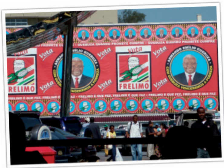
Wahlkampf in Mosambik

Es ist Mittwoch, der 28. Oktober 2009: Wahltag in Mosambik. Schulen und Geschäfte sind geschlossen. Auch in Cambine ist alles ruhig. Nirgendwo im Land kommt es zu Unruhen. Gott sei Dank. In Mosambik finden Wahlen immer an einem Wochentag statt. Der ist dann arbeitsfrei: Wer seine Stimme abgeben will, hat oft einen weiten Weg. Nicht selten muss er im Wahllokal lange Wartezeiten in Kauf nehmen, denn die Menge der Wählerinnen und Wähler ist groß und die Registrierung schwierig.